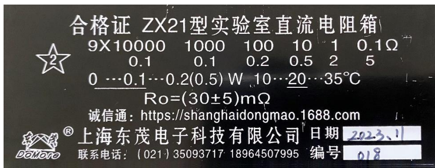
图 3 电阻箱铭牌

高精度电阻精度为 0.1%，备用器件精度为 1%，电阻箱按照设备自身精度等级（见图 3）计算。